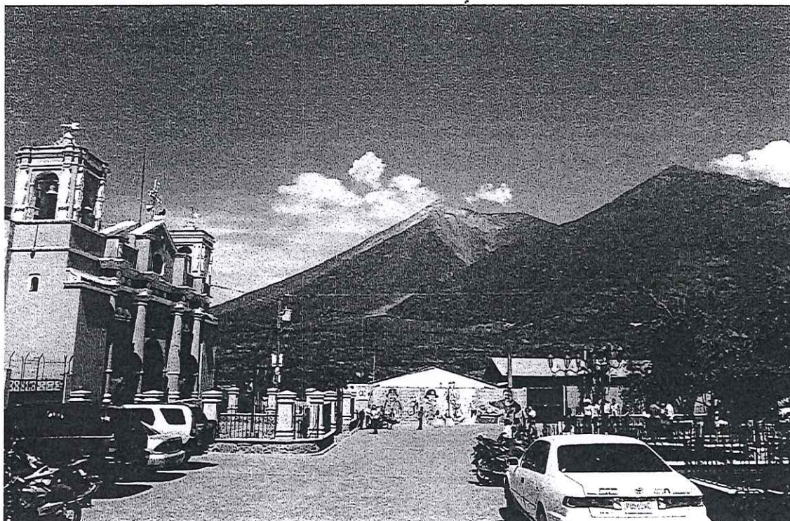
Parroquia de San Juan Alotenango y los volcanes de Fuego y Acatenango.